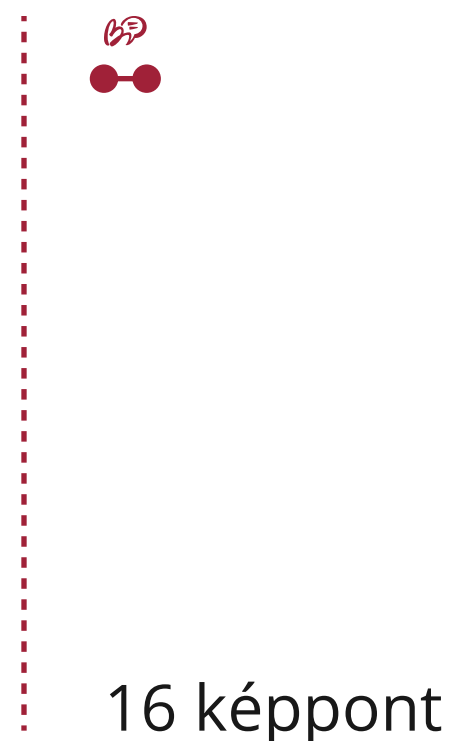
Minimális logó méret